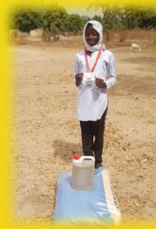
Übergabe Geschenke in Ndofan (Coronahilfe)