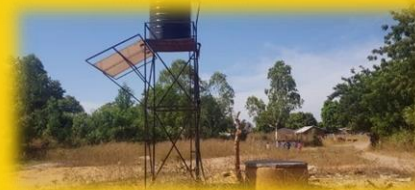
Brunnenprojekt in Ndofan