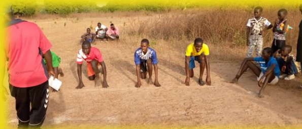
Sportfest Basic Cycle School Ndofan