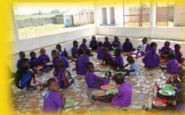
Mittagessen im Kindergarten in Faraba Sutu