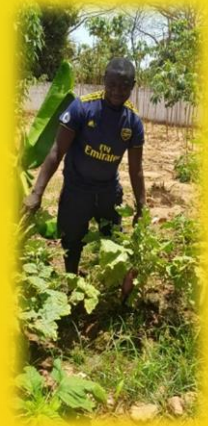
Schulgarten in Faraba Sutu