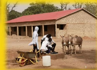
Kinderschutzhaus Darra Kunkujang