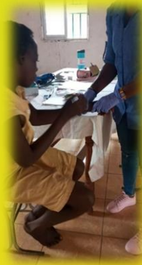
Unsere Mitarbeiterin des FAP bei einer Behandlung