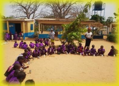
Zahnaktion in Faraba Sutu