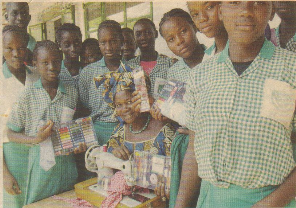
Unterstützung mit Nähutensilien für den Unterricht in Njongon.