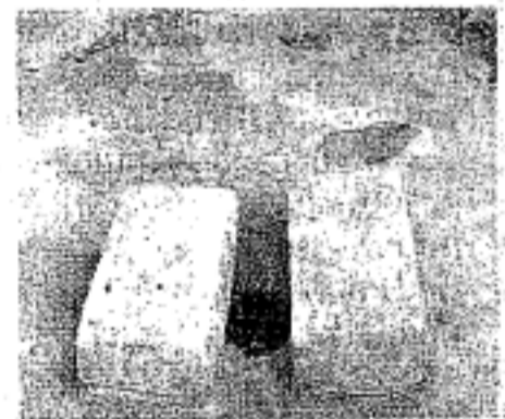
Toilette für 480 Schüler.